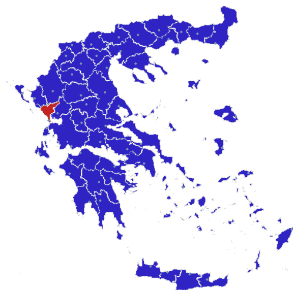
σχ.1: Νομός Πρεβέζης

Έδρα του νέου δήμου ορίστηκε η Φιλιπιάδα.