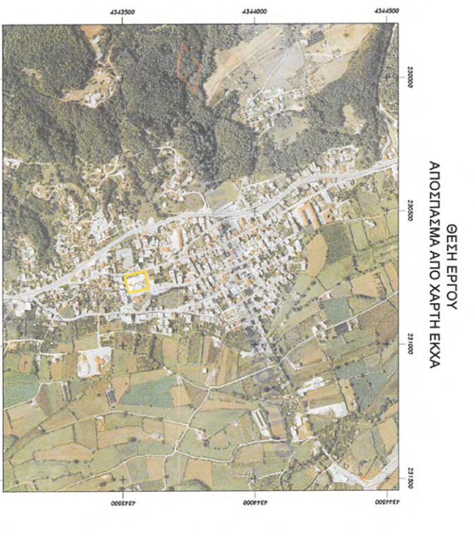
ΦΩΤΟΓΡΑΦΕΙ ΓΕΙΩΜΑΤΕΣ ΕΡΓΟΥ